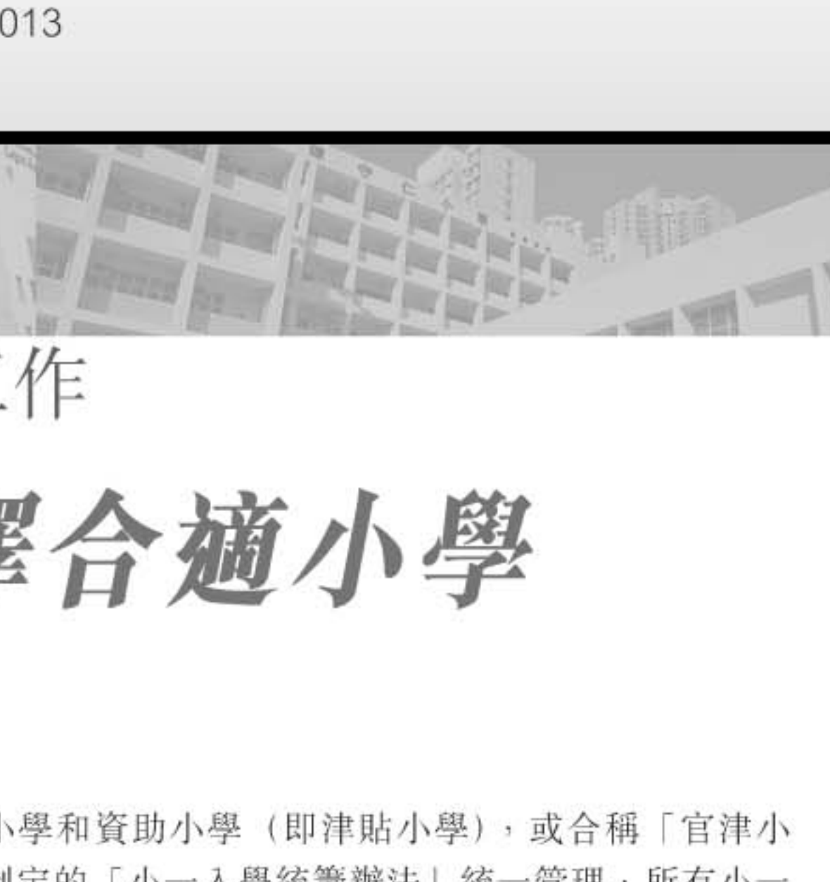
■聖瑪加利男女英文中小學開辦了直資小學。