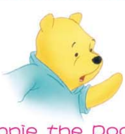
Winnie the Pooh 小熊維尼