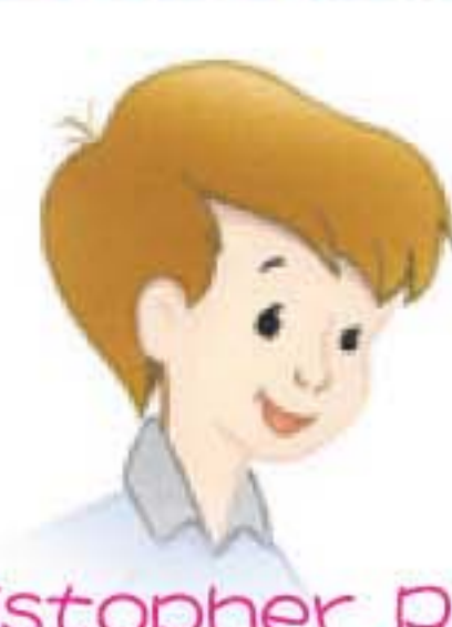
Christopher Robin 羅賓