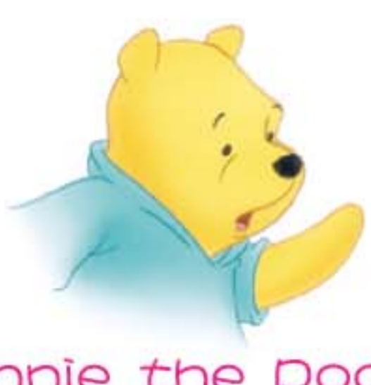
Winnie the Pooh 小熊維尼