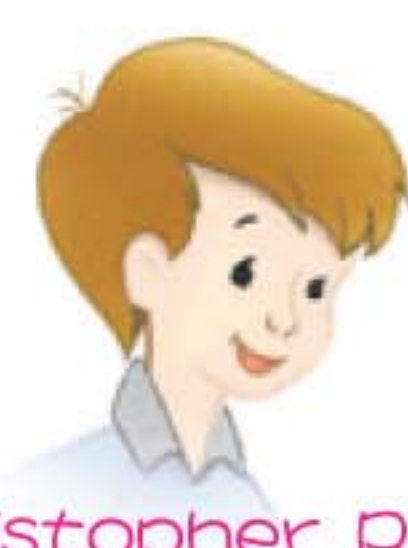
Christopher Robin 羅賓