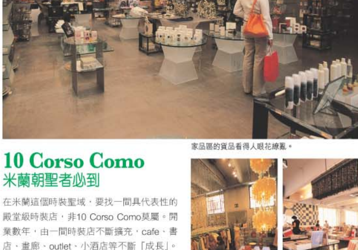
家品區的貨品看得人眼花繚亂。