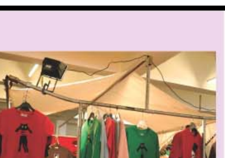
周末的街頭到處都是擺檔，生活用品、平價服飾以至翻版光碟及色情光碟都有。