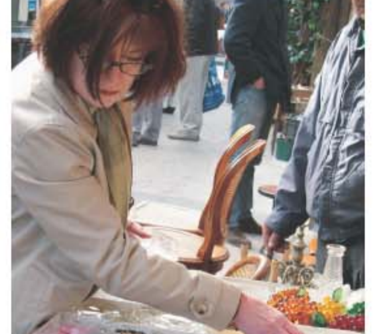
Marche Dauphine專賣古區家居擺設。