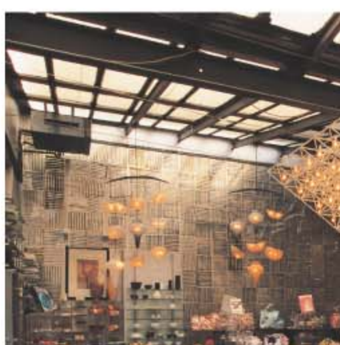
Marche Vernaison以小擺設及家居用品店多。

營業時間：6am-7pm（星期六及日），11am-5pm（星期一至日） 交通：於地鐵站Porte de Clignancourt下車，Ave. Porte de Clignancourt北行便可。