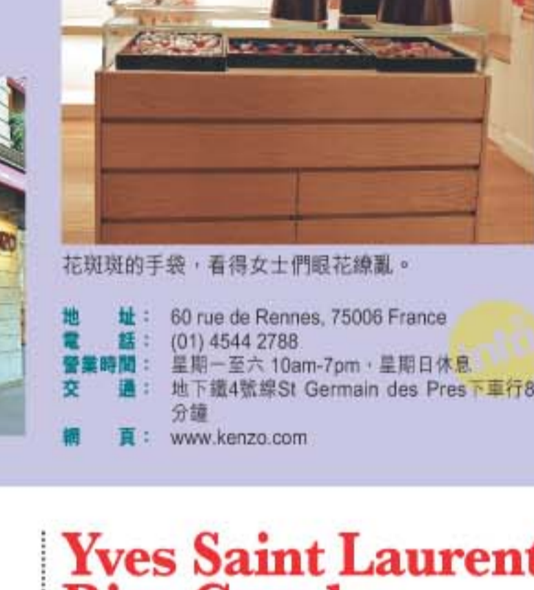
花斑斑的手袋，看得女士們眼花繚亂。

地址：60 rue de Rennes, 75006 France 電話：(01) 4544 2788 營業時間：星期一至六 10am-7pm，星期日休息 交通：地鐵4號線St Germain des Pres下車行8分鐘 網頁：www.kenzo.com