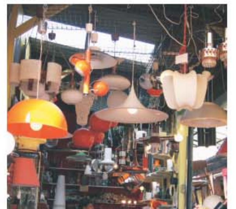
Marche Malassis 有一手二手的衣服、書籍及家具售賣。