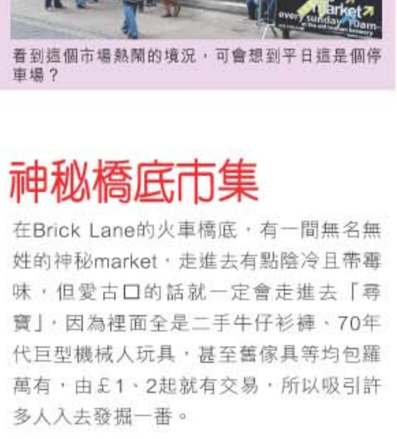
Junkfunk在自家網頁上售賣設計得意的T恤，偶然會在Sunday Up Market擺檔。