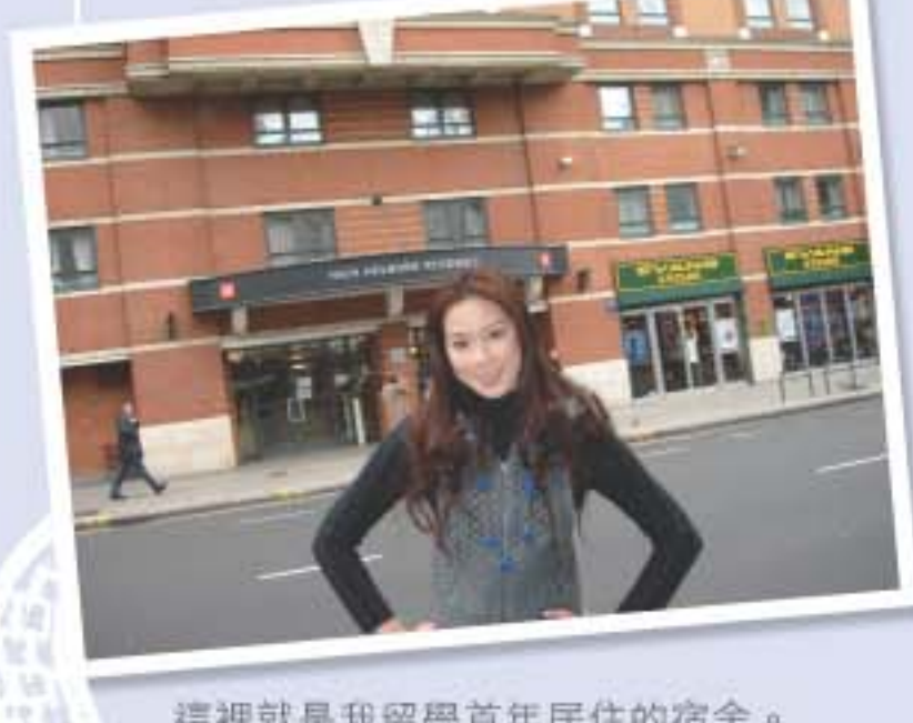
這裡就是我在留學首年居住的宿舍。

學生入學前必須向校方申請宿舍，不同的宿舍環境，均有各自的收費，所以選擇時除因應個人喜好，亦要考慮本身的經濟條件。