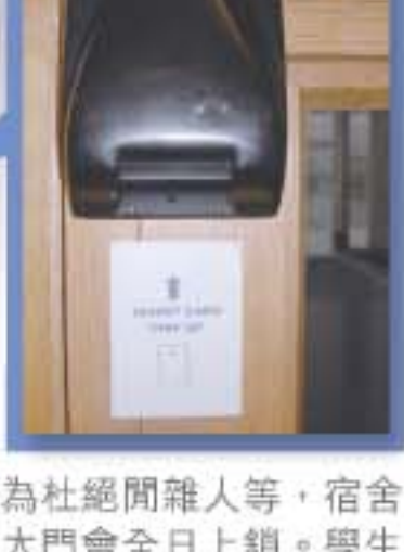
為杜絕閒雜人等，宿舍大門會全日上鎖。學生須輸入密碼或插入出入卡才能夠進入。

住宿最能夠感受大學生活，與一班同學互相交流留學心得，很快就會交到許多朋友，不過住宿有許多規則。學生會有張「出入卡」，有密碼便可以自由進出，但如果要帶朋友入宿舍就好麻煩，校方規定，晚上 8 時前要先帶朋友到宿舍登記，11 時前就要離開。如果朋友要留宿，又要多交 2 鎊，一星期只可以留宿一次。