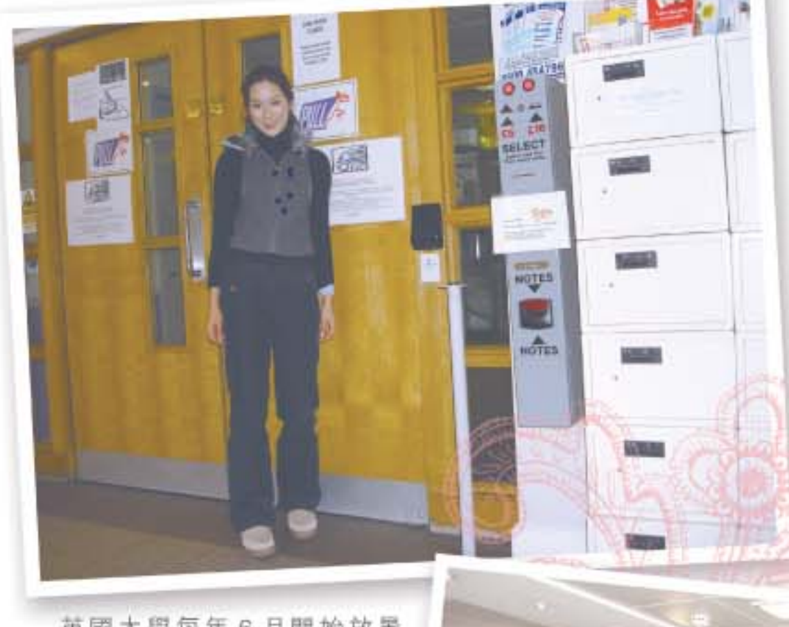
英國大學每年 6 月開始放暑假，到 9 月尾新學年開始之前，所有大學宿舍的房間都會以酒店形式出租，某些房間的租金比 B&B (Bed & Breakfast，提供早餐及住宿的平價旅館) 更便宜。

除了選擇房間類型，宿舍地點亦非常重要。有些宿舍比較近市中心，交通較方便。有些會在學校附近，亦有跟倫敦其他大學生一起住的宿舍，當然這種宿舍的人流會比較複雜。