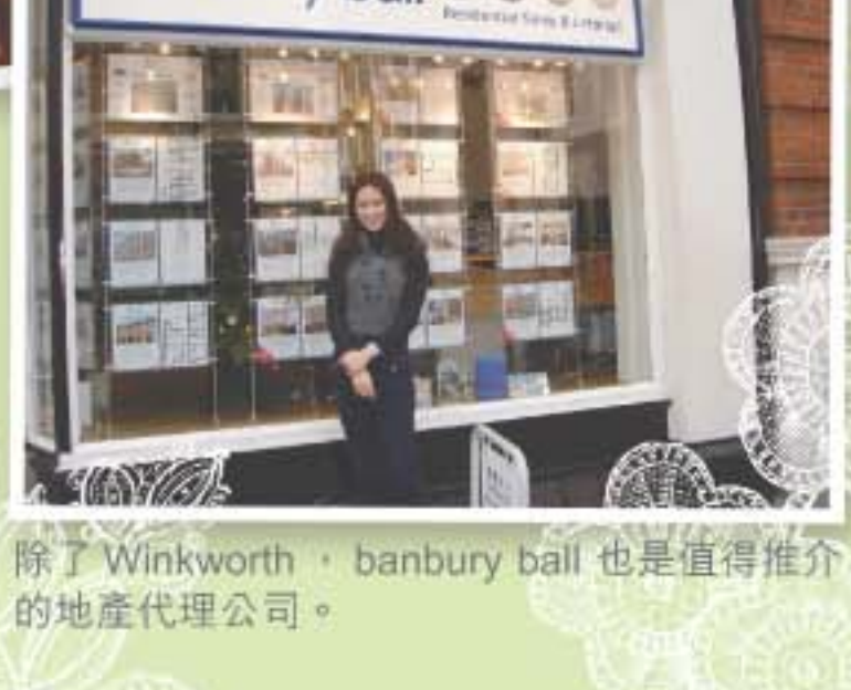
除了 Winkworth，banbury ball 也是值得推介的地產代理公司。