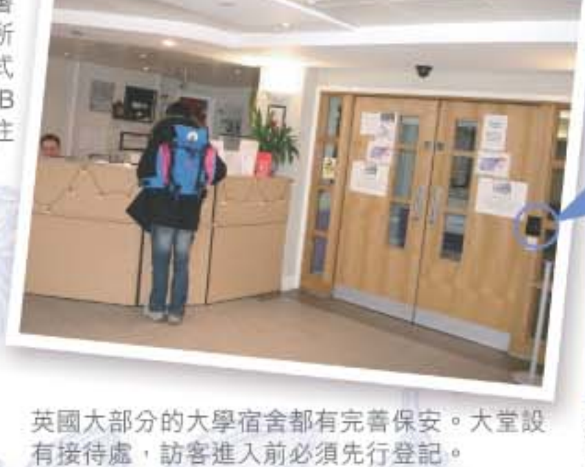
英國大部分的大學宿舍都有完善保安。大堂設有接待處，訪客進入前必須先行登記。

除了選擇房間類型，宿舍地點亦非常重要。有些宿舍比較近市中心，交通較方便。有些會在學校附近，亦有跟倫敦其他大學生一起住的宿舍，當然這種宿舍的人流會比較複雜。