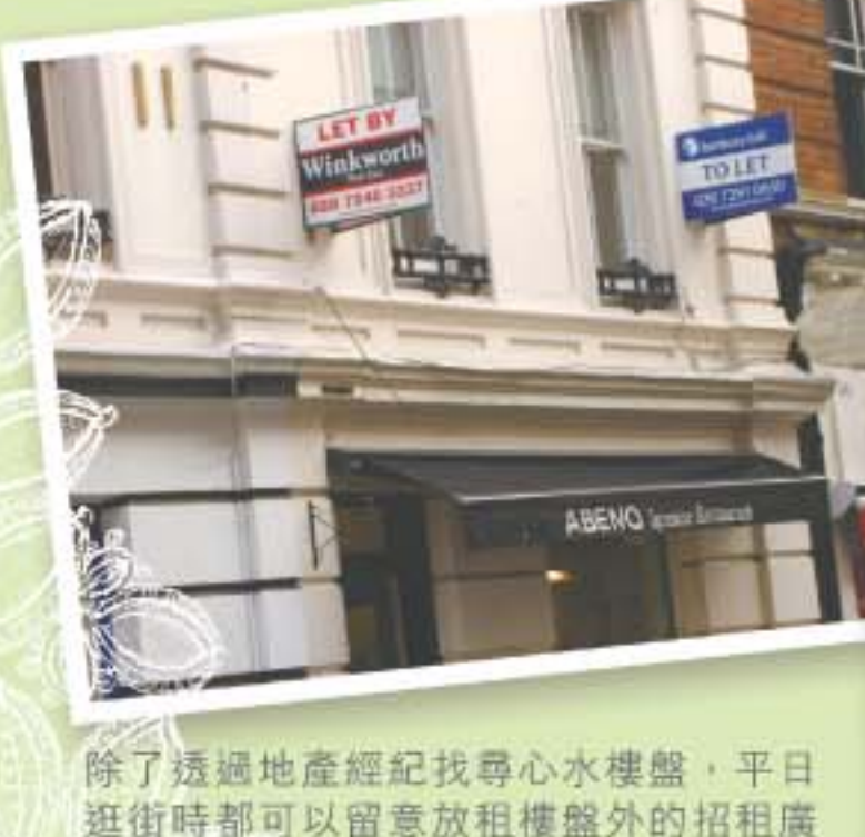
除了透過地產經紀找尋心水樓盤，平日逛街時都可以留意放租樓盤外的招租廣告。鎖定目標地區再開始睇樓，自然節省不少時間。