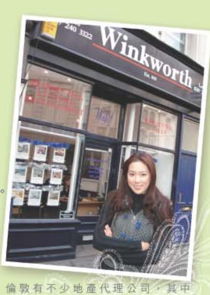
倫敦有不少地產代理公司，其中 Winkworth 信譽佳而且規模較大，旗下樓盤選擇多。

倫敦的租金比香港更貴，當年我住的單位離校大概 7 分鐘路程，面積大約五百餘呎，每月租金便要 1,500 鎊，即兩萬多港元！又要交電費、水費、煤氣費、電話費，開支非常大。