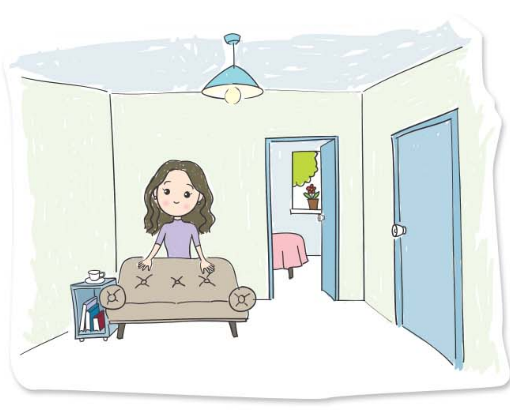
今個學年便要一個人住在這裡了！