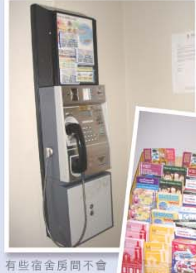
有些宿舍房間不會設有電話，宿舍大堂的公用電話可予學生使用電話卡打長途電話。

當地家庭： 約 3,500-5,500 英鎊，一般在平日會包括早晚兩餐，而周末則包括早午晚三餐。