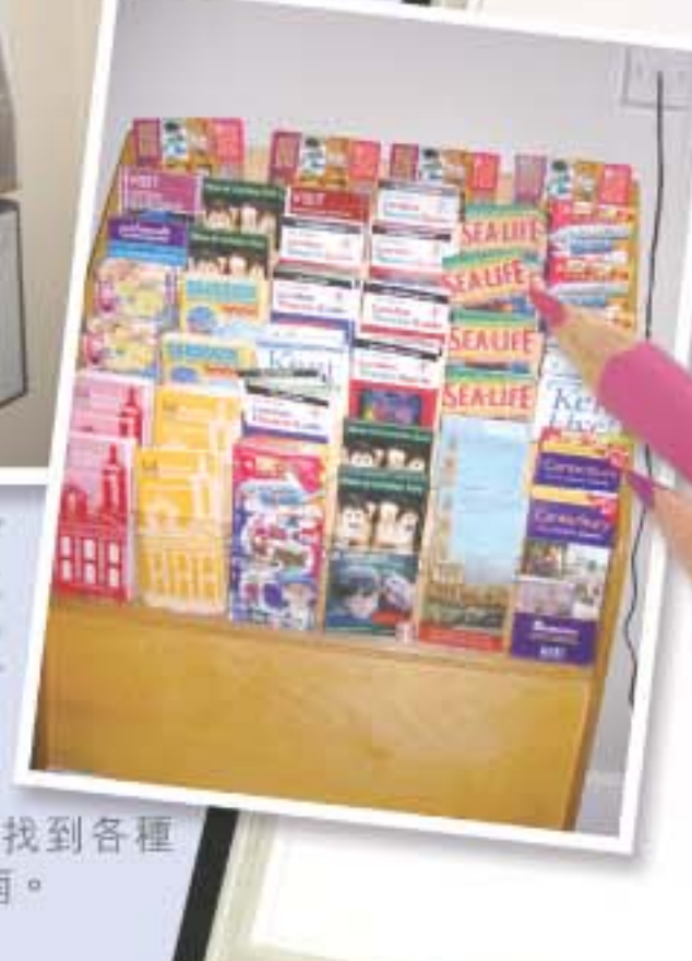
在宿舍接待處可以找到各種旅遊及文娛活動指南。

可以成為宿舍社長、社員的學生畢竟少之又少，所以許多學生——正如我，大學第二年便需要自己另覓住所。