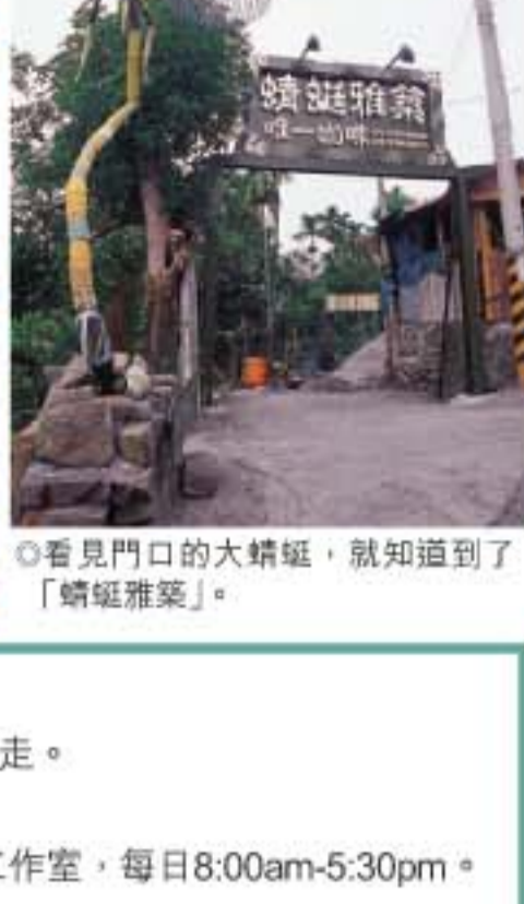
◎看見門口的大蜻蜓，就知道到了「蜻蜓雅築」。