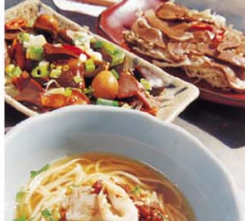
◎「度小月擔仔麵」的精簡在於麵上的肉燥(即肉碎)，做法是把豬腿肉剁碎，與台灣口一起爆炒，再加入調味料經長時間燉煮，令肉燥入口香濃惹味。招牌擔仔麵每碗HK$12 (NT$50)，份量不多，食客經常要再來一碗。