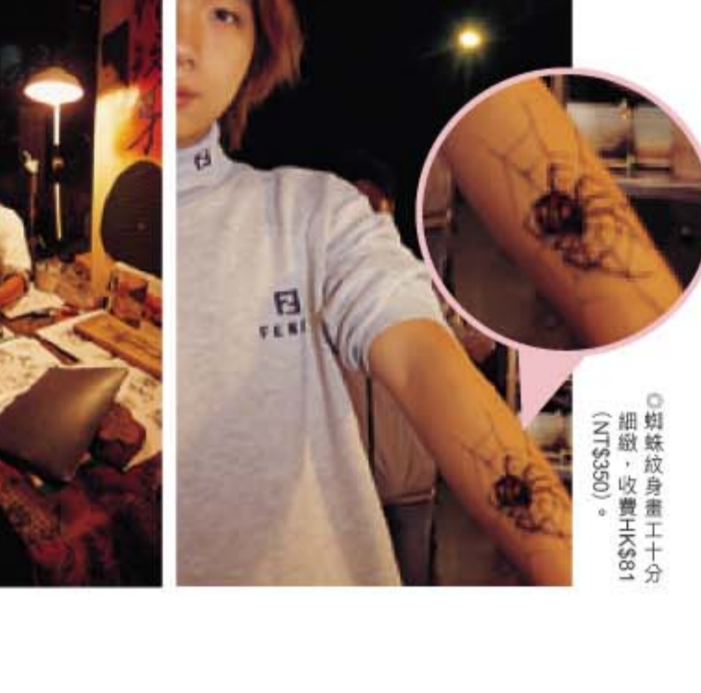
◎蜘蛛紋身重十分細紋，收費HK$81 (NT$350)。

◎在「全港最西區餐廳」前(墾丁路229號)，有一無痛紋身攤檔，最低消費HK$23 (NT$100)起，紋身約一星期後會脫掉。