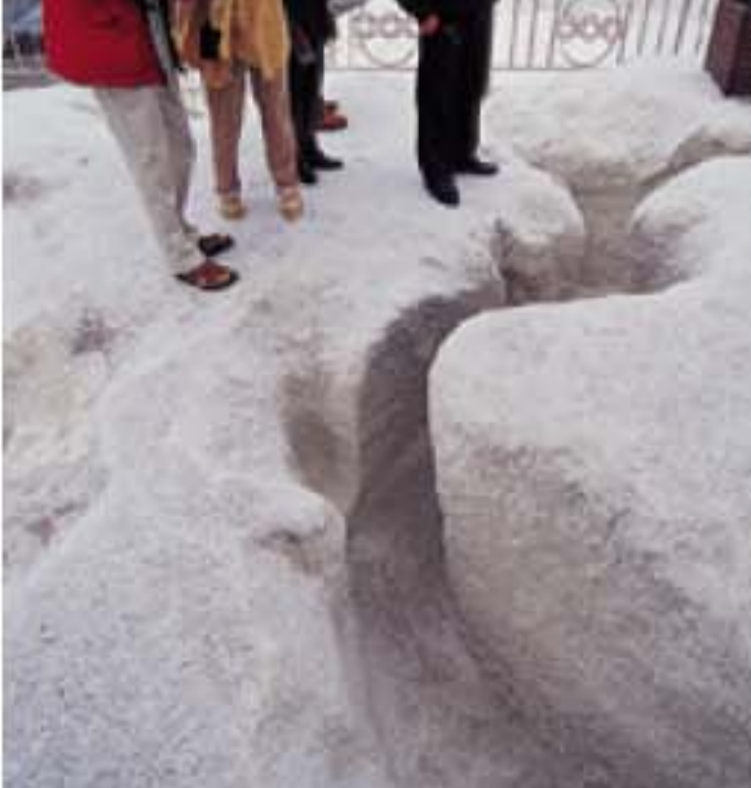
◎不少遊人都會抓起地上的鹽粒細看。

近年來，鹽業沒落，唯一保留下來的鹽山已變成觀光勝地，遊人可登上高達五、六層樓的山頂，觀賞極目無邊的鹽田，白茫茫一片的壯觀場面，可媲美雪景。