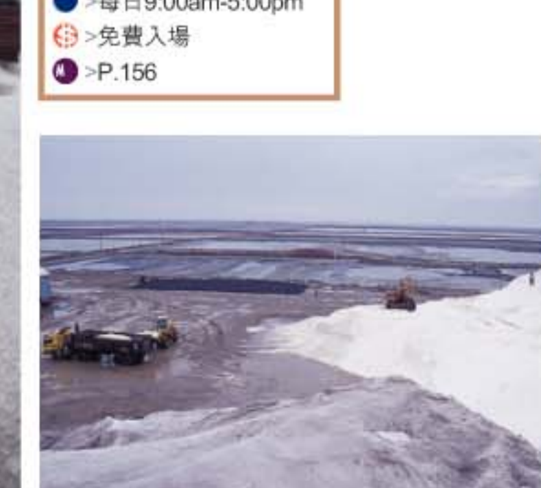
◎偶爾可見鹽田上有重型挖土機，把雪白的鹽堆高高鏟起倒在大貨車上。