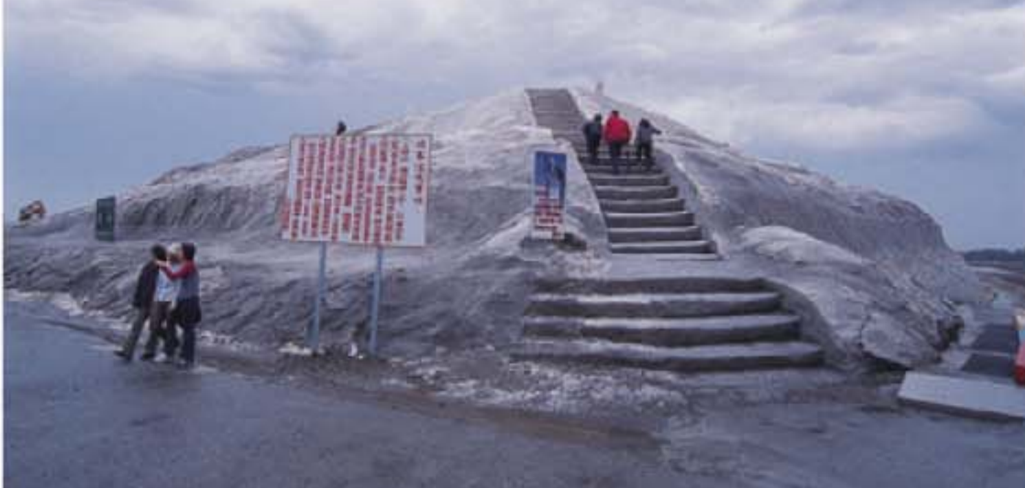
◎遊人眾多，設有梯級上頂的大鹽山已被踏平。