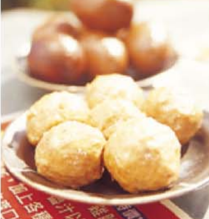
◎吃麵之餘，可嚐嚐其他特色小吃，大大粒彈牙貢丸(前)每粒HK$2 (NT$10)，甘香鹵蛋(後)每隻HK$2 (NT$10)。

無人不知的「度小月」並非真有其人，話說當年始創人洪芋頭本是漁民，為幫補捕魚淡季的生活，便挑口擔子到街上賣麵，由於當地人稱這段淡季日子為「小月」，這個為度過「小月」而生的擔仔麵，便給起名為「度小月」，而且愈賣愈旺，至今已度過百年，還發展至出產罐裝肉燥，每罐HK$140 (NT$600)。