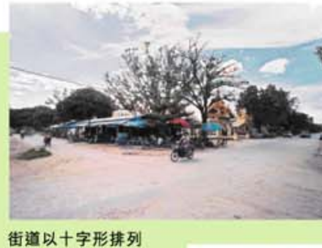
街道以十字形排列，並以號數命名，十分容易辨認。