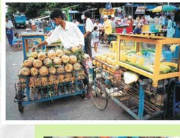
位於 84 街的曼德勒市集，街頭小食琳瑯滿目。